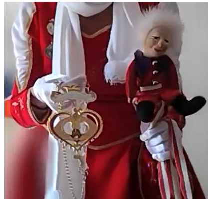
Die Karnevalsprinzessin in königlichem Gewand und ihre Insignien